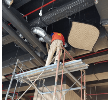
Gambar 1. Hasil jadi lampu gantung rattan ceiling (Fauzan, 2025)