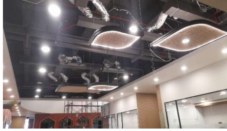
Gambar 4. Pengaplikasian lampu gantung rattan ceiling (Fauzan, 2025)