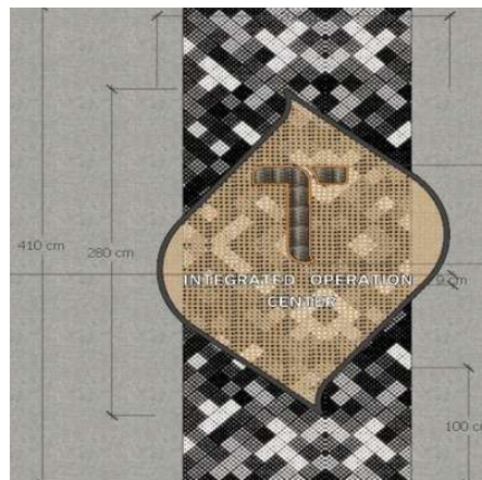
Gambar 2. Gambar 3d lampu gantung rattan ceiling (Fauzan, 2025)